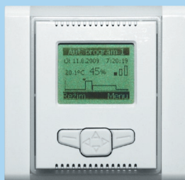
Regulátor ZR 15 (digitální)

Pro ovládání max. 8 ks jednotek iV14 nebo 4 ks iV Twin nebo 4 ks iV25