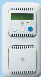
Centrální regulátor ZR 30 (digitální)

Pro ovládání max. 8 ks jednotek iV14 nebo 4 ks iV Twin nebo 4 ks iV25