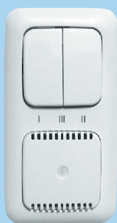
Regulátor ZR 10 (manuální)

Pro ovládání max. 4 ks jednotek iV14 nebo 2 ks iV Twin nebo 2 ks iV25