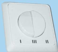
Miniregulátor ZR 6 (manuální)

Pro ovládání max. 2 ks jednotek iV14 nebo 1 ks iV Twin nebo 1 ks iV25